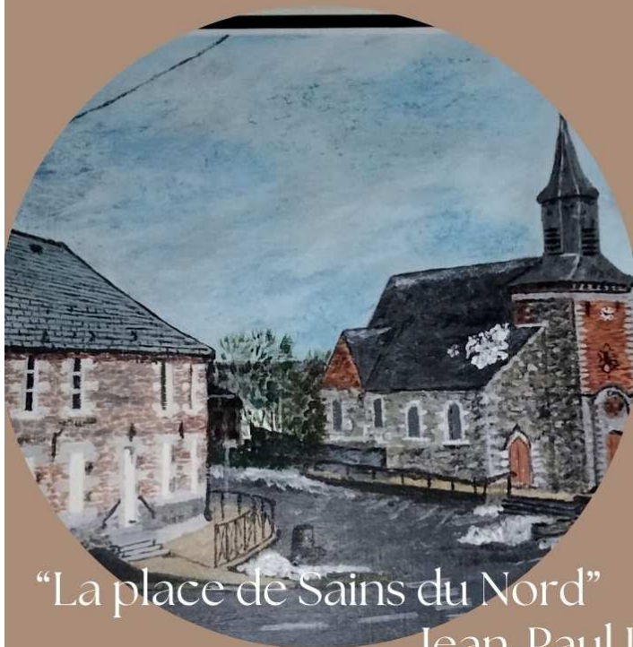
“La place de Sains du Nord”