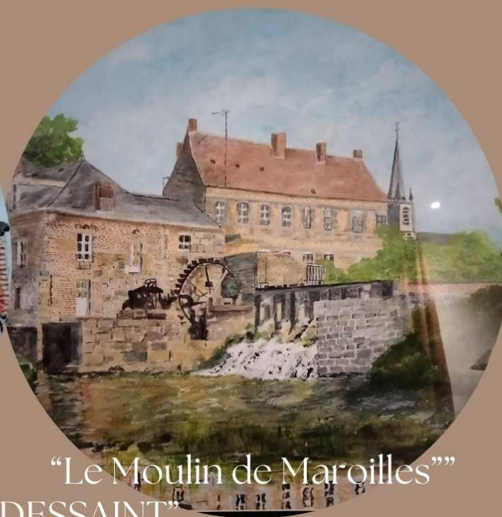
“Le Moulin de Maroilles”